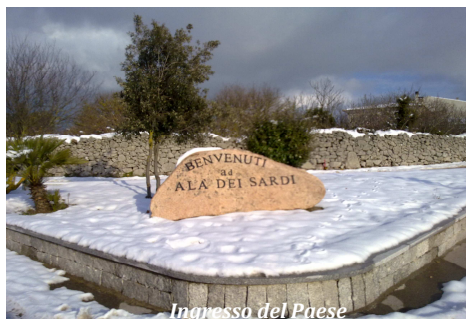
Ingresso del Paese